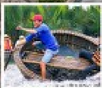
นั่งเรือกระด้ง