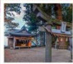
ศาลเจ้าฟูกูโอกะ