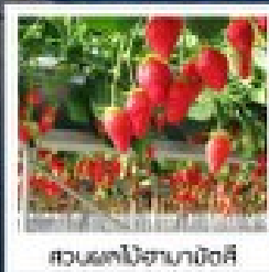
สวนผลไม้ฮามานิดสึ