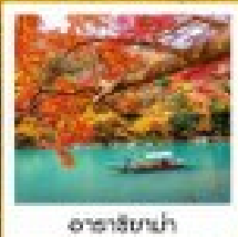
ฮารุชิมางะ