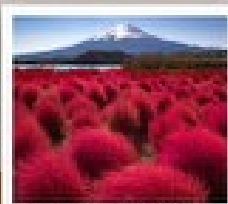
สวนโอะฮิชิ ภารัง

วัดเมียวโตะจิน / ถนนเมียวโตะจิน โฮโมเตะชินโด / พิพิธภัณฑ์ ชิราคาวาโกะ / ซินมาชิ ซูจิ / คามิโกจิ / สะพานกินปะ / สวนโอะฮิชิ ภารัง / ศูนย์บริการนักท่องเที่ยว / โอชิโนะ ฮัทสึ / สวนโอะวะคิเนน / วัดอาซากุสะ / ตลาดปลาซึกิจิ / ซึเอมิจิฮิมิจุกุ / มิดซึบะ เฮอท์เล็ท พาร์ค คิซารุชิ