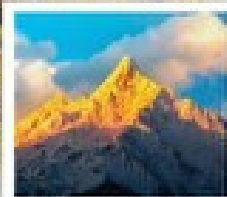
ภูเขาหิมะเท๋นเป่ย์