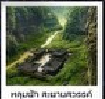
อุทยานแห่งชาติหวางเจียง