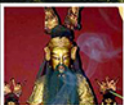
เอียงบู๊ซิว