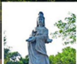
เจ้าแม่ก๊กกิม