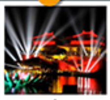
สวนชิงหิงซ่างเหอหยวน