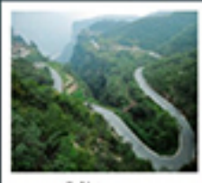
ไท่หิงซาน

หอซุนฮิว / ห้างสรรพสินค้าฟ้างวงหลาย เมืองโกเจียง / สวนชิงหิงซ่างเหอหยวน ไร่ราชวงก่ง / แกรนด์เกษมยอนไท่หิงซาน หมู่เขาดอกท้อ / ถนนลอยฟ้า หมู่บ้านทิวเขียงซุม / 5๐๓เก้าหสิบ กำหินหลงหมิน / เมืองโบราณทิวอี่ ไร่การะแสดงวิทยาศาสตร์ล้ำหับ