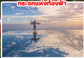
กระจอกแห่งท้องฟ้า