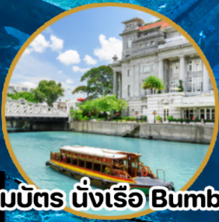
รวมบัตร นั่งเรือ Bumboat