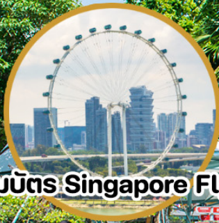
รวมบัตร Singapore Flyer