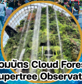
รวมบัตร Cloud Forest + Supertree Observatory