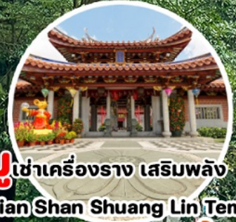
บู เข้าเครื่องราง เสริมพลัง Lian Shan Shuang Lin Temple