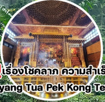
บู เรื่องโชคลาภ ความสำเร็จ Loyang Tua Pek Kong Temple