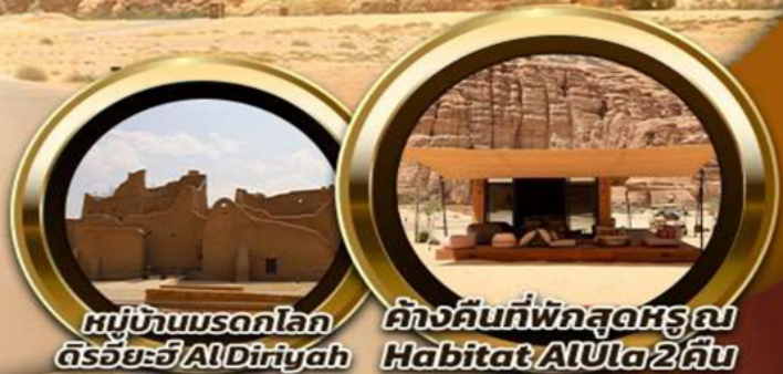
หมู่บ้านมรดกโลก ดิริยาฮ์ AlDiriyah