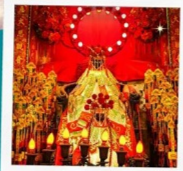
เจ้าแม่กวนอิมฮ่องฮ่า