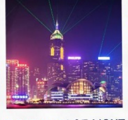
SYMPHONY OF LIGHT