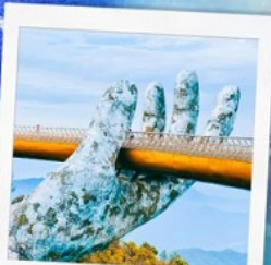
บาน่าฮิลล์