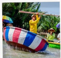
เรือกระดิ่ง