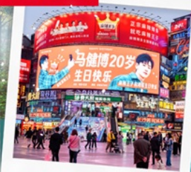
ถนนคนเดินหวงซิงสู