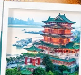
หอถึงหวงเก้อ