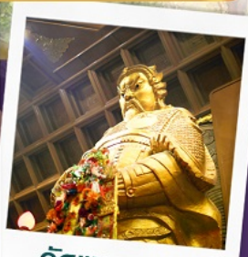
วัดเขาถ้ำกมิมิว