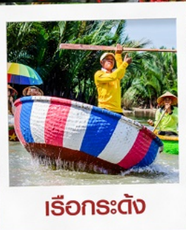
เรือกระด้าง