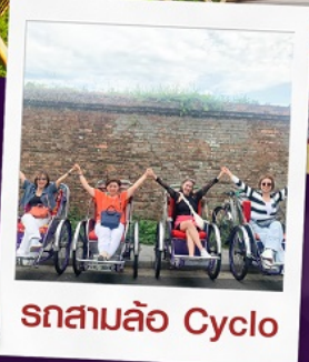
รถสามล้อ Cyclo