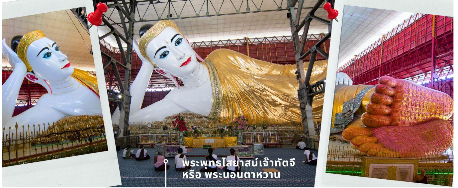
พระพุทธรูปไสยาสน์เจ้ากัตติ หรือ พระนอนตาหวาน

นำท่านสักการะ พระพุทธรูปไสยาสน์เจ้ากัตติ หรือ พระนอนตาหวาน ซึ่งเป็นพระพุทธรูปไสยาสน์องค์ขนาดใหญ่ที่มีความสูงถึง 6 ชั้น ยาวกว่า 70 เมตร ใช้โครงเหล็กกันถึง 65 เมตร มีหลังคาคลุม 6 ชั้น สร้างขึ้นเมื่อปี 1907 ถูกยกย่องให้เป็นพระนอนที่มีขนาดใหญ่และงดงามที่สุดในพม่า ด้วยพระพักตร์ที่งดงามเป็นอนิยม ดวงตาที่จากลูกแก้วที่สังผลิตจากต่างประเทศ ทาขอบตาด้วยสีฟ้าและมีขนตาหวานยาวทำให้ดวงตาดูหวาน จนถูกเรียกพระนามอีกชื่อคือ “พระตาหวาน” บริเวณพระบาทมีภาพวาดลายธรรมจักร ตรงกลางฝ่าพระบาทล้อมรอบด้วยรูปมงคล 108 ประการ ที่แสดงถึงอากาศโลก สัตว์โลก และสังขารโลก อีกทั้งจิวยังมีลักษณะพริ้วไหวสมจริงและตรงชายประดับด้วยอัญมณีแวววาว ถือเป็นพุทธศิลป์ที่มีความงดงามทรงคุณค่า