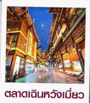
ตลาดเดินหัวงเมี้ยว