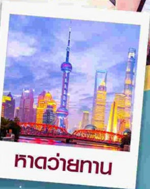
ทาดว่ายทาน