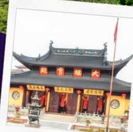
วัดพระหยก