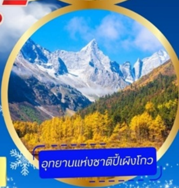
อุทยานแห่งชาติหนีเป่ิงโกว