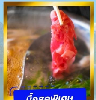
มือสุดพิเศษ