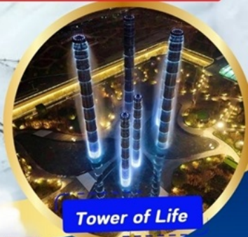
Tower of Life

อุทยานภูเขาสี่ฤดู หุบเขาของเฉียวโกว (รวมรถอุทยาน) อุทยานหนีเป่ิงโกว(รวมรถอุทยาน + รถแบตเตอรี่ ) ภูเขาหิมะการ์เซียต้ากู่ปิงชว่น (รวมรถอุทยาน+กระเช้า) - วัดต้าฉือ ถิ่นคนเดินชุนซีลู่ - ชมแสงสี The Tower of Lifeที่ลานห้าง SKP ถนนคนเดินชอยกวางแคม - POP MART