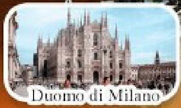
Duomo di Milano