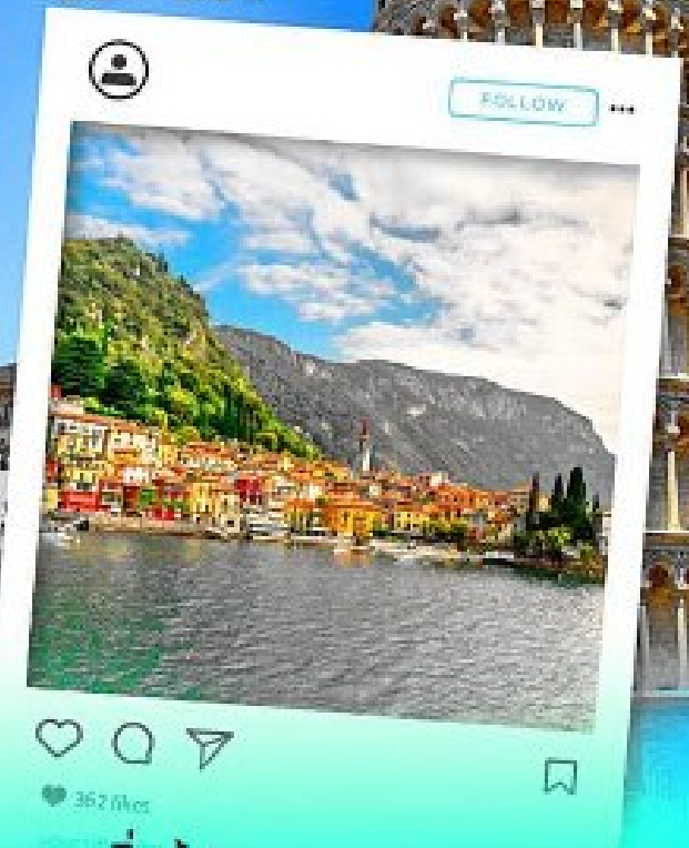
Arco Della Pace