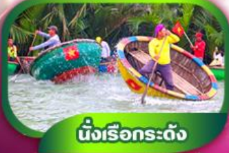
นั่งเรือกระดง