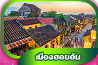
เมืองฮอยอัน