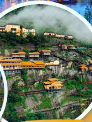
คุมเขาเทวดา