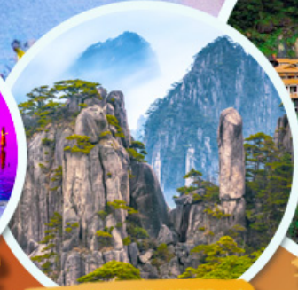
ภูเขาหวงชาน