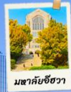
พิพิธภัณฑ์ชิววา