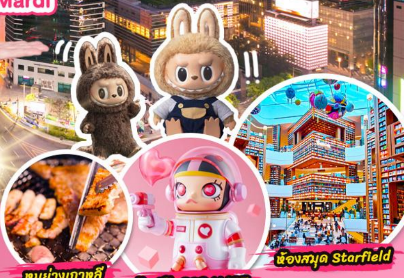
เมนูย่างเกาหลี

ช้อปปิ้ง 6 แบรินด์ดัง POP Mart / Carlyn / Stand Oil Emis / Marithé / Mardi