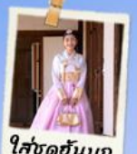
ใส่ชุดฮันบก