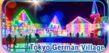
Tokyo German Village