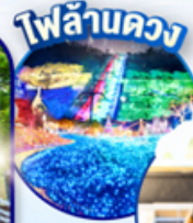
ไฟล้านดวง