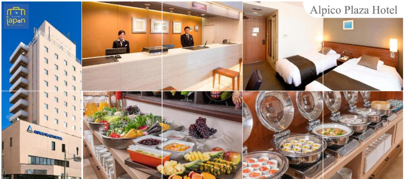
Alpico Plaza Hotel

พักที่ ALPICO PLAZA HOTEL หรือเทียบเท่าระดับเดียวกัน