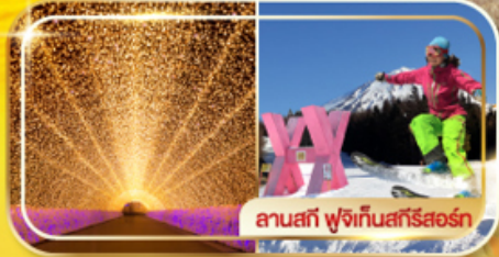
ลานสกี ฟุจิกินสกีรีสอร์ท