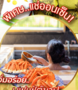
อิมมอร์รี่... บุฟเฟ่ต์ชาบู