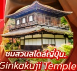
ชมสวนสโตนี่ญี่ปุ่น... Ginkakuji Temple