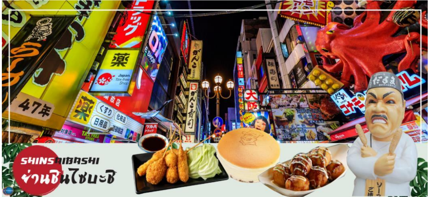
เย็น รับประทานอาหารเย็นอิสระตามอัธยาศัย

อิสระช้อปปิ้ง ย่านชินไซบาชิ (Shinsaibashi) บริเวณแหล่งช้อปปิ้งแห่งนี้มีความยาวประมาณ 600 เมตร เต็มไปด้วยร้านค้าปลีก ร้านแฟชั่นร้านเครื่องสำอางค์ ร้านรองเท้า กระเป๋า นาฬิกา ร้านกาแฟ ร้านอาหาร ร้านขนม ร้านเสื้อผ้าสตรีทแบรนด์ทั้งญี่ปุ่นและต่างประเทศ เช่น Zara H&M Beans ABC Mart เป็นต้น เรียกว่ามีทุกอย่างที่ต้องการรวมกันอยู่บริเวณนี้ ใกล้กันท่านสามารถเดินไปยัง ย่านโดทงโบริ (Dotonbori) ย่านบันเทิงยามค่ำคินดอลอดแนวถนนเลียบบคลองโดทงโบริ จากสะพานโดทงโบริบาชิไปจนถึงสะพานนิปปอนบาชิ ไฮไลท์!!! ใครๆ ก็เชิดฉิ่ง ถ่ายภาพคู่ ป้ายกูลิโกะแมน หรือ ป้ายโดทงโบริกูลิโกะ (Dotonbori Glico Sign) เป็นป้ายไฟนีออนรูปนักกรีฑากำลังวิ่งอยู่บนลู่วิ่ง ซึ่งถูกติดตั้งมาตั้งแต่ ปี ค.ศ.1935 นอกจากนี้ยังมีอีกหนึ่งสัญลักษณ์สถานที่นัดพบกันหลง นั่นก็คือ ร้านปูคานิโดรากุ (Kani Doraku) ซึ่งมีปูยักษ์ขยับแขนและลูกตาได้อีกด้วย และห้ามพลาดสำหรับทาโกะยากิ อาหารท้องถิ่นของชาวโอซาก้า ที่มาถึงถิ่นแล้วต้องลอง Original Taste รับรองไม่ผิดหวังแน่นอน