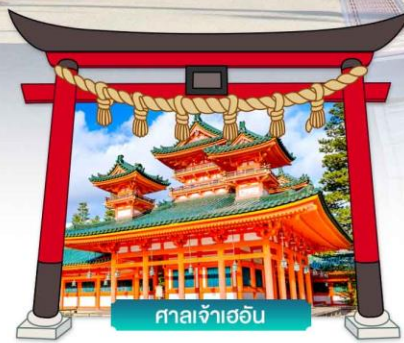
ศาลเจ้าเฮอัน