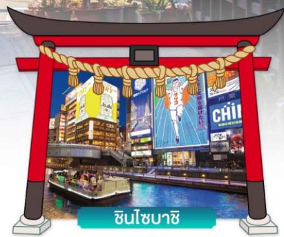
ชินโซนาชิ

เดินทางโดยสายการบินแอร์เอเชียเอ็กซ์ 🍴 อาหาร : 6 มื้อ 🏨 โรงแรม : 3 ดาว