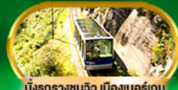
นั่งรถรางชมวิว เมืองเบอร์เกน