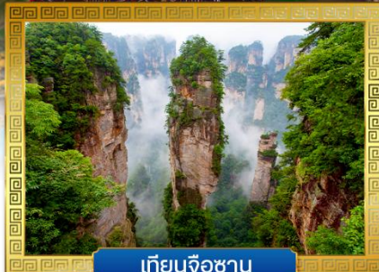
เทียนจื่อซาน

✓ นั่งกระเช้าขึ้นสู่ ... ภูเขาประตูลูกแก้ว