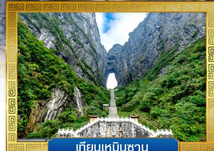
เทียนเหมินซาน