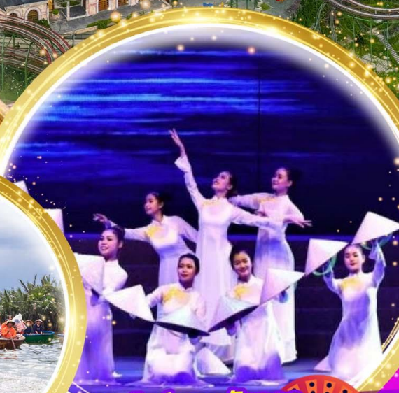
โชว์สุดอลังการ Charming at danang