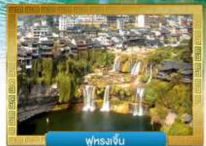
พูหวงเจี้ยน