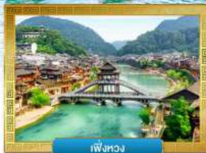
เฟิ่งหวง