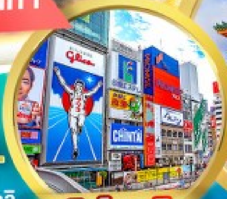
ชินโซบาชิ