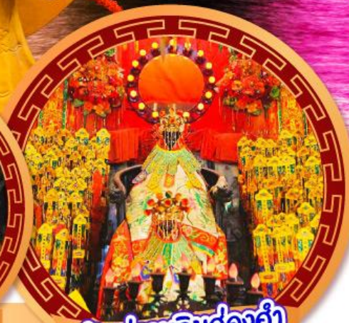
เจ้าแม่กวนอิมฮ่องฮำ

นมัสการเจ้าแม่กวนอิมฮ่องฮำ หมุนกั้งหันรับโชคลากเงินทองที่วัดแชงกหวีจ ขอพรความรักกับผู้เฒ่าจันตรา วัดหวังต้าเซียน