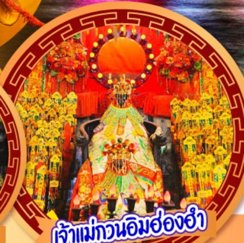
เจ้าแม่กวนอิมฮ่องฮ่า

นมัสการเจ้าแม่กวนอิมฮ่องฮ่า หมุนกังหันรับโชคลากเงินทองที่วัดแชนกหมิว ขอพรความรักกับผู้เต่าจันตรา วัดหวังต้าเซียน