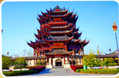
วัดทองหยวน