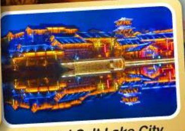
Oriental Salt Lake City