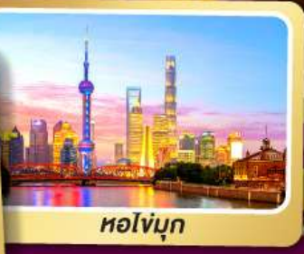
หอไข่มุก