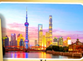
หอไข่มุก