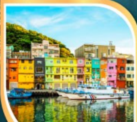
ท่าเรือเจิ้งปิน