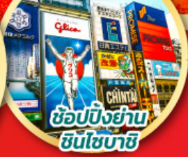
ช้อปปิ้งย่านชินโซบาชิ