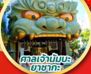
ศาลเจ้าบ๊อบบะ ยาชากะ