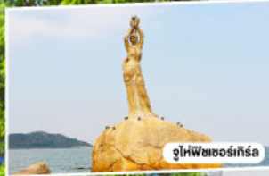
จูไห่พีชเชอร์เกิร์ล