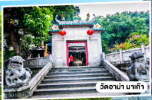
วัดอานา มาเก๊า