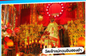
วัดเจ้าแม่กวนอิมของงำ

*นั่งรถข้ามสะพานเซินเจิ้น-จงซาน "สะพานข้ามทะเลที่สูงที่สุดในโลก"