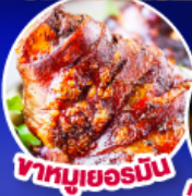
พาหมูเยอรมัน