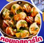
หอยแอสคาร์โก