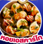
หอยเอสคาร์โก

เดินทาง 11-19 ต.ค.67/ 14-22 พ.ย.67 25 ธ.ค.67 - 2 ม.ค.68(เทศกาลปีใหม่)