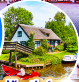
หมู่บ้านกีธูร์น