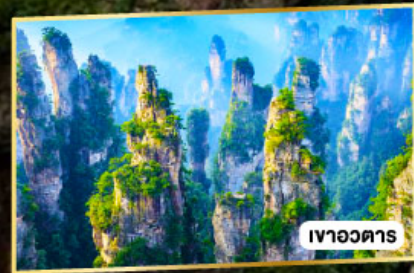
เวาอวดาร