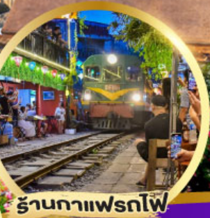
ร้านค้าเฟรตโฟ