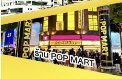
ร้าน POP MART