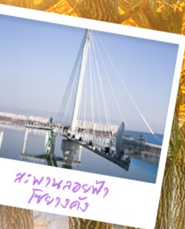
สะพานลอยฟ้า โซยางคัง