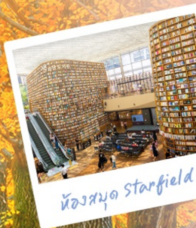
ห้องสมุด Starfield