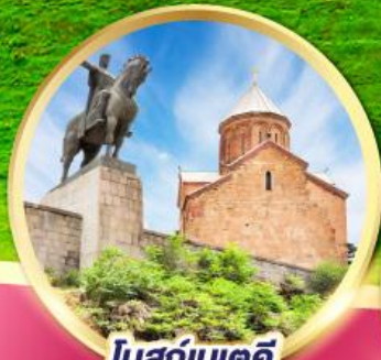
โบสถ์เมเตคี