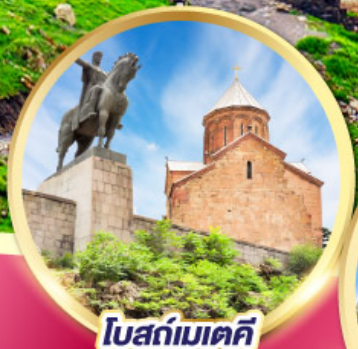
โบสถ์เมคคี